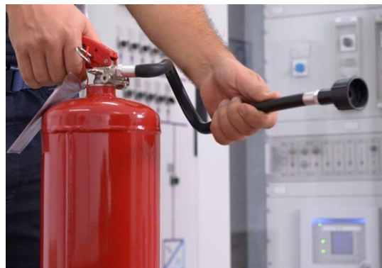
SLIKA 4 – ZAŠTITA OD POŽARA

Broj zaposlenih, njihova osposobljenost i raspoloživa oprema zavisi od obima i specifične opasnosti kod poslodavca.