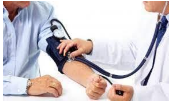
SLIKA 7 – ZDRAVSTVENI PREGLEDI ZAPOSLENIH

Vrstu, način, obim i rokove obavljanja zdravstvenih pregleda propisuje organ državne uprave nadležan za poslove zdravlja, uz saglasnost organa državne uprave nadležnog za poslove rada.