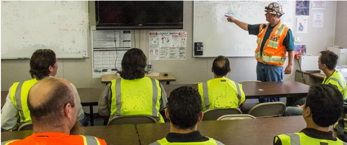
SLIKA 6 – OSPOSOBLJAVANJE ZA BEZBJEDAN RAD

Poslodavac je dužan da izvrši osposobljavanje zaposlenog kod zasnivanja radnog odnosa, raspoređivanja na drugo radno mjesto, nove tehnologije, uvođenja novih ili zamjene sredstava za rad, promjene procesa rada i ponovnog raspoređivanja na rad nakon odsustva koje je trajalo duže od godinu dana.