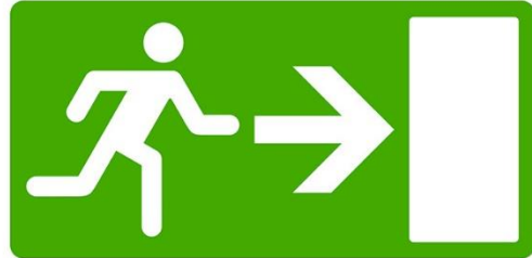
SLIKA 5 – PUTEVI EVAKUACIJE

Ne može se zahtijevati od zaposlenih da nastave rad u situaciji u kojoj postoji ozbiljna i neposredna opasnost, osim u slučaju spašavanja ljudskih života.