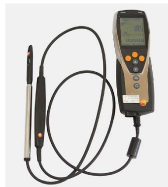
SLIKA 1 – ISPITIVANJE USLOVA RADNE SREDINE