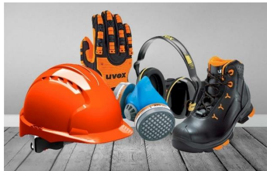
SLIKA 3 – LIČNA ZAŠTITNA SREDSTVA

Zaposleni su dužni da sredstva za rad i sredstva i opremu lične zaštite na radu koriste u skladu sa njihovom namjenom i da u postupku upotrebe primjenjuju propisane mjere zaštite i zdravlja na radu.